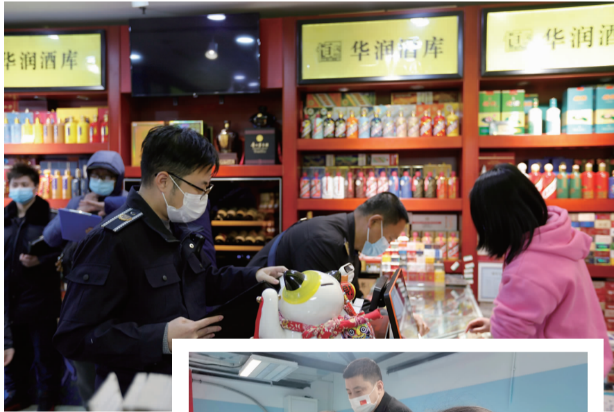
▲工作人员查看店铺相关资质文件