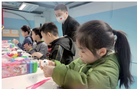
小朋友现场制作冬奥吉祥物▶