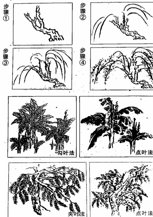
■文/杨纯(和平村一社区)

另外,椿树和槐树的树叶结构差不多,但椿叶大于槐叶。点叶时椿树要先勾主筋再点叶,槐树无需勾筋,只要点出大致形状就可以了。