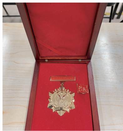
抗日战争胜利70周年纪念章