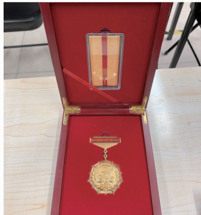
抗日战争胜利70周年纪念章