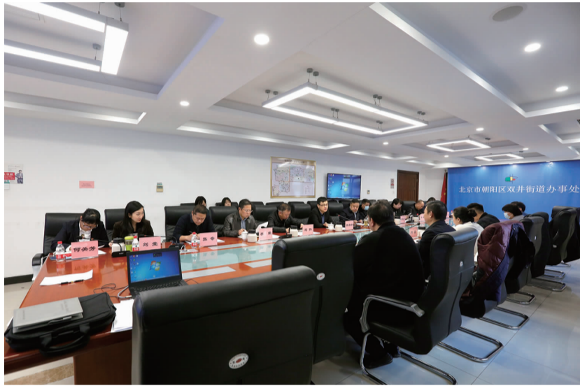
评审组在双井街道听取现场汇报

会议结束后,专家组对双井街道12个点开展走访调研,并对安全社区相关材料档案开展检查。经过一天的检查,评审组对双井街道安全社区建设工作表示肯定,同时也指出检查中发现的问题,双井街道将根据相关要求整改,共建安全社区。