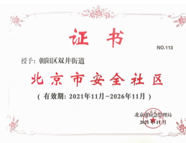
双井街道荣获“北京市安全社区”称号 专家组对双井有关点位开展走访调研